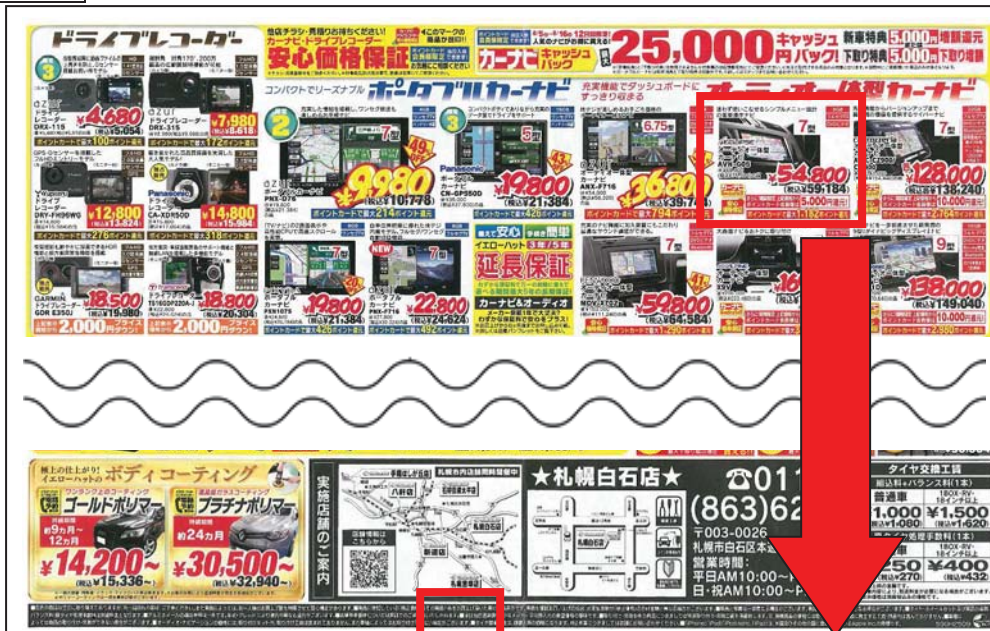
表示例 平成28年8月5日配布の新聞折り込みチラシ

「㊦」と称する価額は、別表2「店舗名」欄記載の店舗において同表「商品名」欄記載の商品について最近相当期間にわたって販売された実績のないものであった。