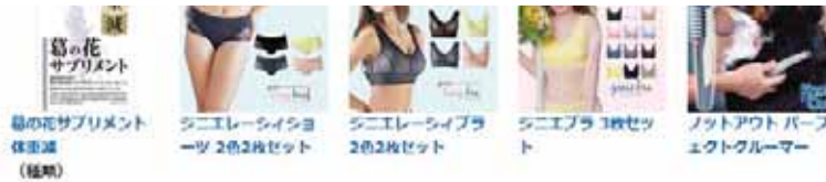
葛の花サプリメント 体脂肪 (種類)