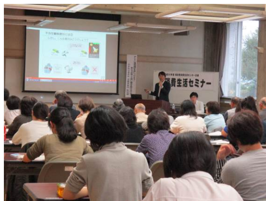
平成30年10月27日（福井市）