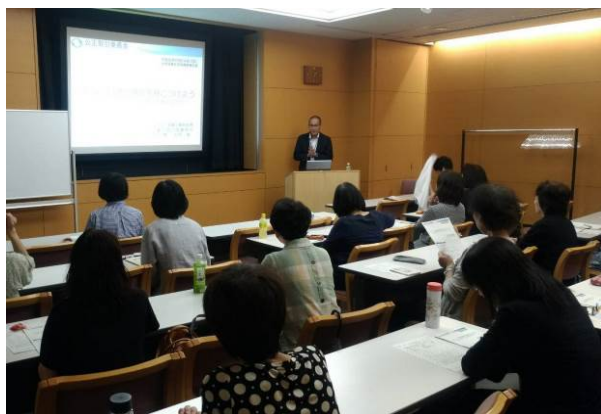
平成30年6月24日（京都市）