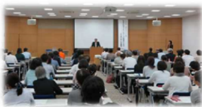
研修の様子(徳島市内)