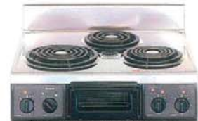
複数口こまろ(前面操作のみ)