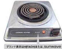
ブランド表示はHITACHIまたは、SUNWAVE