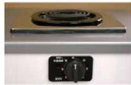
一口こまろ(前面操作) ※写真は富士工業製

身体や物が接触し、意図せずスイッチが「入」となる可能性がある構造であったために、電気こまろの上や周囲に可燃物が置かれていて、火災事故に至る危険性があります。