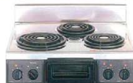
複数口こまろ(前面操作のみ)