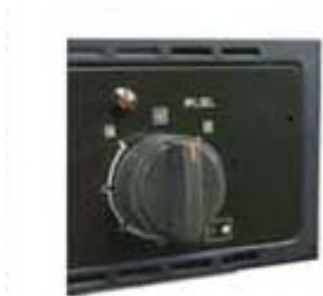
改修前：カバーなし