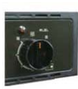
改修後：カバー付き