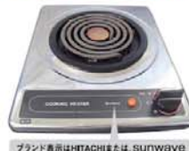
ブランド表示はHITACHIまたは SUNWAVE 一口こまろ(上面操作)