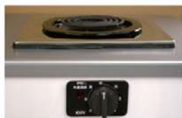
一口こまろ(前面操作) ※写真は富士工業製

身体や物が接触し、意図せずスイッチが「入」になる可能性がある構造であったために、電気こまろの上や周囲に可燃物が置かれていて、火災事故に至る危険性があります。