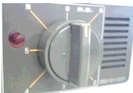
改修前：カバー無し