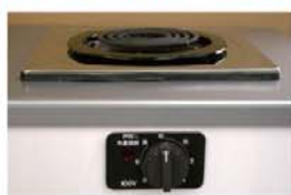
一口こまろ(前面操作) ※写真は富士工業製

身体や物が接触し、意図せずスイッチが「入」となる可能性がある構造であったために、電気こまろの上や周囲に可燃物が置かれていて、火災事故に至る危険性があります。