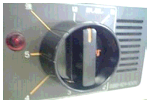
改修後：カバー付き