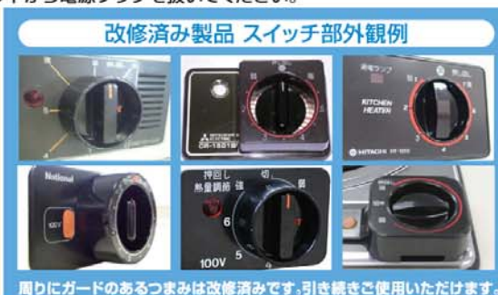
改修済み製品 スイッチ部外観例