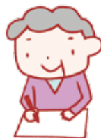
図2 健康食品手帳の例