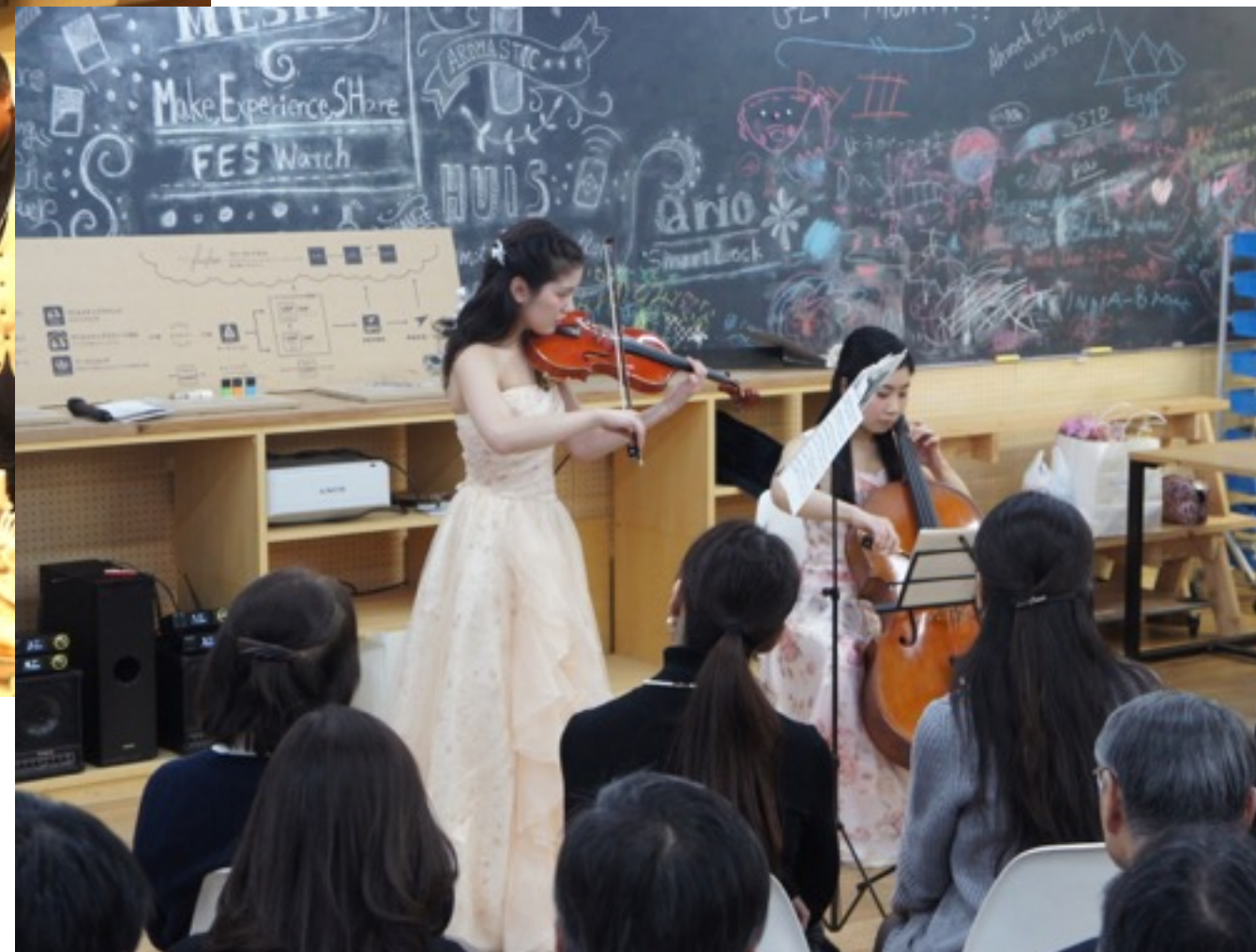
講師によるコンサート