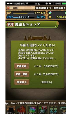
年齢確認と上限金額