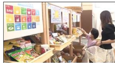
〈コミュニティパントリー〉

企業、食料支援実施団体（フードバンク、こども食堂等）、行政が連携した地域循環型食品ロス削減ネットワークを中心となり構築。フードバンク活動の拡充、常設型フードドライブの推進、コミュニティパントリー（無料のフードマーケット）の実施に加え、食品ロス削減の啓発活動等、幅広く活動を行い、消費者と事業者双方の意識向上に貢献。