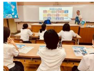
〈学校への出前授業〉