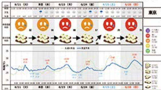
6月22日(水)発表 JWA特別気象予測 相模屋食料様 寄せ豆腐

気温の変動や季節により異なる、人間の暑さへの感じ方を表した「体感気温」を、SNSの気温に関する"つぶやき"データを基に数式化して精度の高い需要予測を実施。その結果、寄せ豆腐で約30%、冷やし中華つゆで約20%の食品ロス削減を実現。