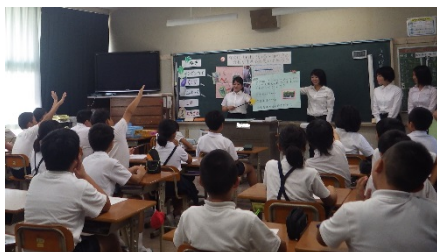
〈替え歌を歌い踊った〉