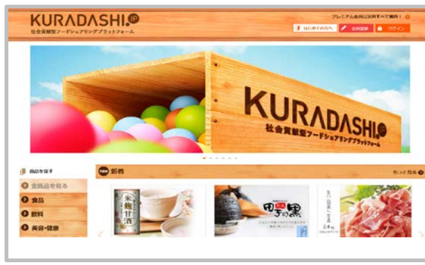
〈社会貢献型フードシェアリングプラットフォーム「KURADASHI.jp」ウェブサイト〉