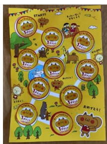
専用台紙にシールを10枚集める