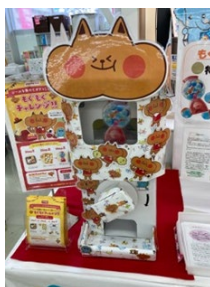
イベントへの参加