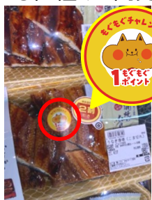
店舗で、もぐもぐチャレンジ専用シールが貼られた期間間近の商品を購入

店舗側は売りきりの工夫、消費者は楽しみながら食品ロス削減に貢献できる仕組みを開発