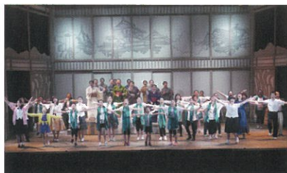
東温市民ミュージカル 城ノブ～愛媛のマザー・テレサ～(2017年4月)