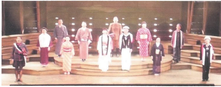
2018年10月、世界初「アジア8K映像演劇祭」開催。2019年6月、ロシアで8K「誓いのコイン」上映。

坊っちゃん劇場は、地域に密着しながら学校教育活動や地域・企業・団体との文化交流活動にも大きく貢献しています。