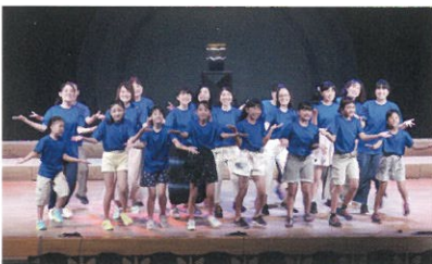
砥部町民ミュージカル シンパシーライジング～砥部焼物語～(2017年7月)