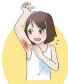
脱毛エステによるやけど