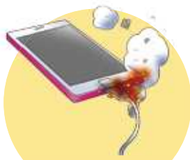
スマホ充電中にコネクターから発煙・発火