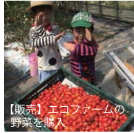
【販売】エコファームの野菜を購入