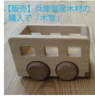
【販売】兵庫県産木材の購入で「木育」