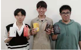
【販売】フェアトレード商品を購入