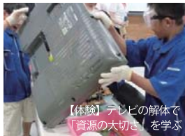
【体験】テレビの解体で「資源の大切さ」を学ぶ