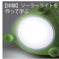
【体験】ソーラーライトを作って学ぶ