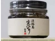
【販売】兵庫産のりの購入で「地産地消」