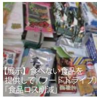
【展示】食べない食品を提供して「フードドライブ」「食品ロス削減」