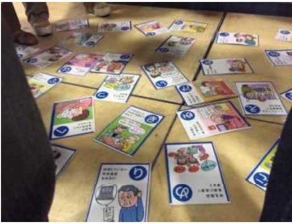
↑ハエ叩きで悪質商法を撃退！かるた大会