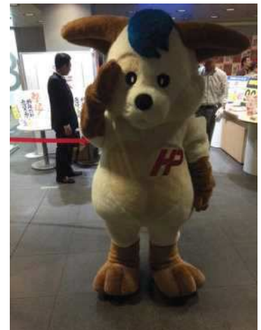
↑ほくとくんが大活躍！