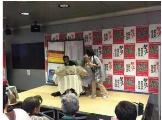
↑劇団による訪問販売の寸劇！笑いも