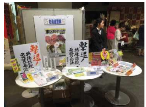
↑警察グッズ紹介コーナー