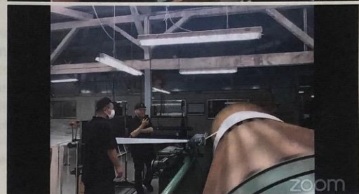
毎年、ファンが参加する工場見学を開催。2020年は、Zoomストアを利用した新規客からの提案で、ZoomとYouTubeライブを組み合わせてオンラインで実施

せん。他の取引店と同じように、普通に商品を仕入れて販売してくれています。イケウチのファンなので安心感もあり、それぞれの人脈や関係性でファンがさらに増える可能性もあるはずですが。店を増やす方法は、直営店だけではないと思っています。