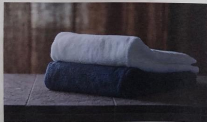
IKEUCHI ORGANICは厳しい基準をクリアしたオーガニックコットン100%の自社ブランドのタオルを製造・販売している

現在は京都店が開店する前の1時間、1組だけ受け付けています。ただ、店が開店している時間でも、来店されているお客様が画面に映らない状態であれば、Zoomをつなぐことができると分かったので、希望があれば営業中でも対応していきたい。お客様の声を聞きながら、進化させていきたいと思っています。