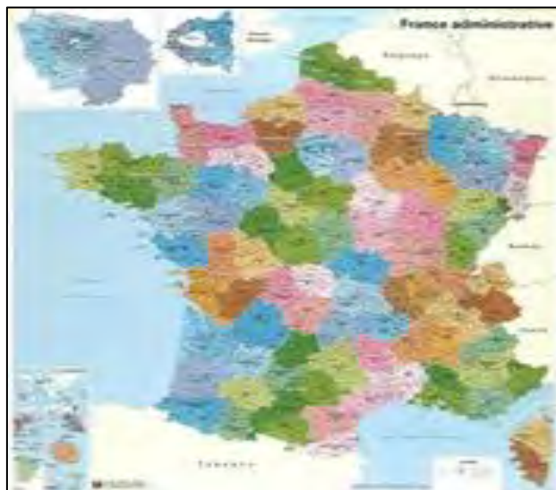
図3 DGCCRF/地域ごとの編成