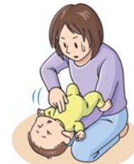
図4: 胸部突き上げ法 (乳児)