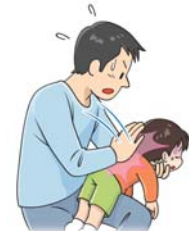
図1: 背部叩打法 (幼児)