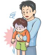
図2: 腹部突き上げ法 (幼児)