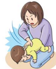
図3: 背部叩打法 (乳児)