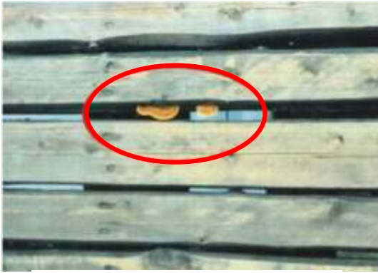
木材（ヒノキ）に発生したキノコ