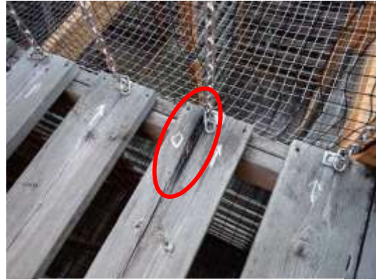
つり橋の敷板端の腐朽