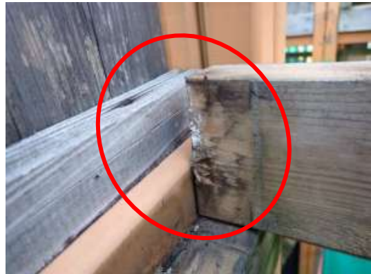
(消費者庁資料より)