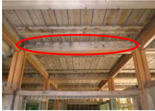
床板と床板の隙間付近の水が流れ落ちた跡