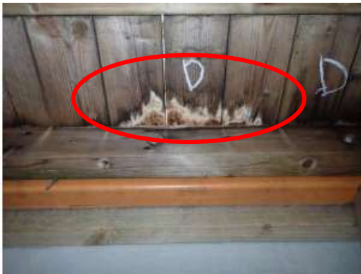
(消費者庁資料より)