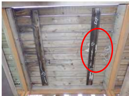
(消費者庁資料より)