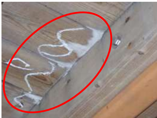
(消費者庁資料より)