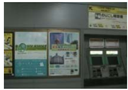
東葉高速鉄道株式会社