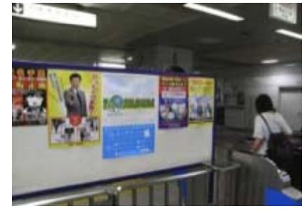
千葉都市モノレール株式会社