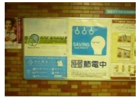
東京地下鉄株式会社(東京メトロ)