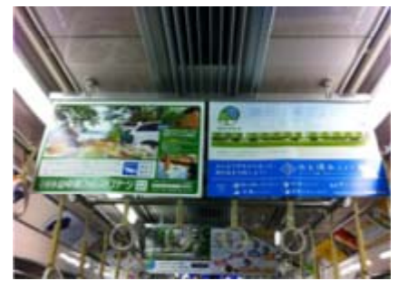
小田急電鉄株式会社