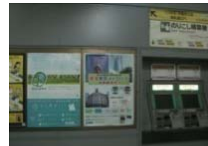
東葉高速鉄道株式会社