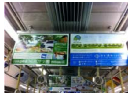
小田急電鉄株式会社