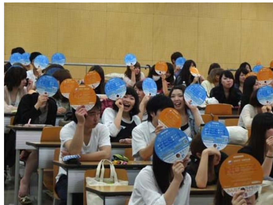
＜学生たちがYesNoうちわを使っている授業風景＞