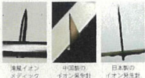
海風イオンメディック 中国製のイオン発生針 日本製のイオン発生針

一見すると同じような「針」に見えますが、安定して大量のマイナスイオンを発生させるために、高品質の素材と技術を注ぎ込んでいます。