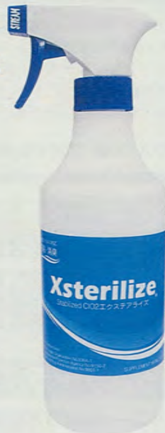
エクステアライズスプレー