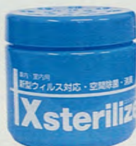
エクステアライズゲル