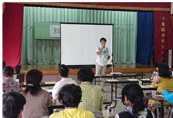
宮古島市におけるセミナーの様子