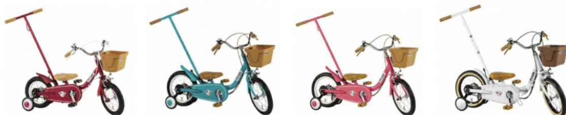
12 インチ スカーレット 14 インチ ブルーミングターコイズ / ブルーミングラズベリー 14 インチプレミアムホワイト