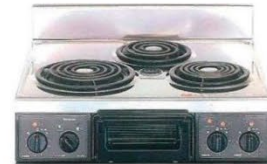
複数口こまろ(前面操作のみ)