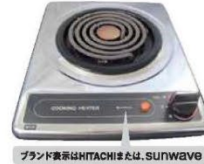
一口こまろ(上面操作) ブランド表示はHITACHIまたは.SUNWAVE