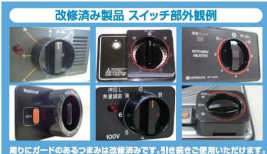
改修済み製品 スイッチ部外観例