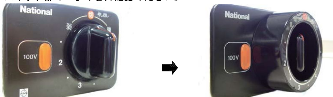
改修前：カバーなし