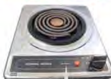
一口こまろ(上面操作) ブランド表示はHITACHIまたはSUNWAVE