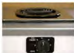
一口こまろ(前面操作) ※写真は富士工業製

身体や物が接触し、意図せずスイッチが「入」となる可能性がある構造であったために、電気こまろの上や周囲に可燃物が置かれていて、火災事故に至る危険性があります。