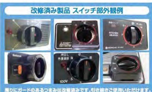
改修済み製品 スイッチ部外観例