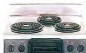
複数口こまろ(前面操作のみ)