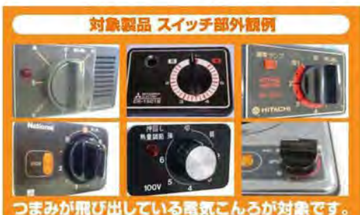
対象製品 スイッチ部外観例