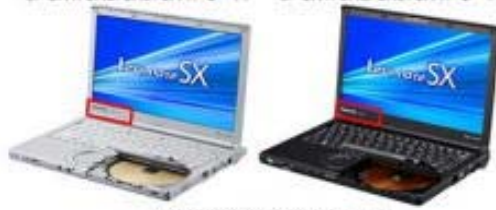
CF-SX1/SX2/SX3/SX4シリーズ CF-SX1/SX2/SX3/SX4シリーズ

Panasonic CF-SX1/SX2/SX3/SX4 または Panasonic CF-NX1/NX2/NX3/NX4