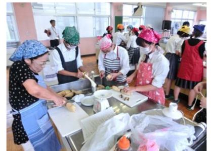
エシカル料理教室 （地域の高校と連携）

持続可能な社会の実現に向けて地域における「エシカル消費」を定着させるため、広いネットワークを持ち、消費生活において重要な役割を担っている女性の力を活用し、学校とも連携しながら地域社会へのエシカル消費の普及啓発を行う。