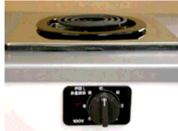
一口こんろ (前面操作) ※写真は富士工業製

身体や物が接触し、意図せずスイッチが「入」となる可能性がある構造であったために、電気こんろの上や周囲に可燃物が置かれていて、火災事故に至る危険性があります。