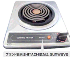
一口こんろ (上面操作) ブランド表示はHITACHIまたは、SUNWAVE