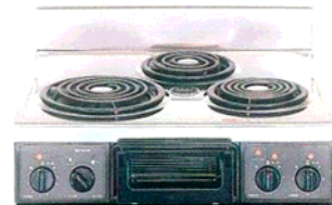
複数口こんろ (前面操作のみ)