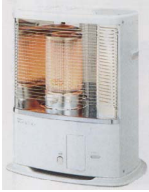
(写真はS X - 3 0 4 0)