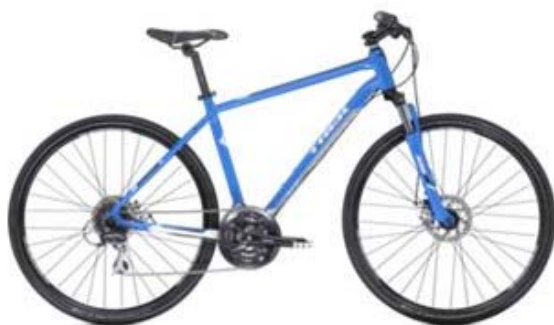
2013 Trek 8.3 DS