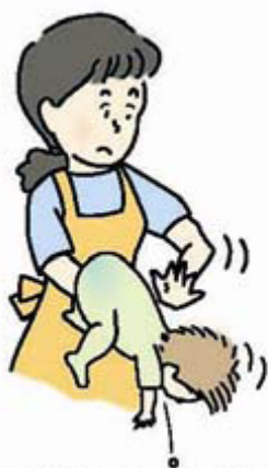
図1 背部叩打法 (乳児)

乳幼児では、口の中に指を入れずに、乳児は片腕にうつぶせに乗せ顔を支えて(図1)、また、少し大きい子は立て膝で太もがうつぶせにした子のみぞおちを圧迫するようにして(図2)、どちらも頭を低くして、背中の中を平手で何度も連続して叩きます。なお、腹部臓器を傷つけないよう力を加減します。