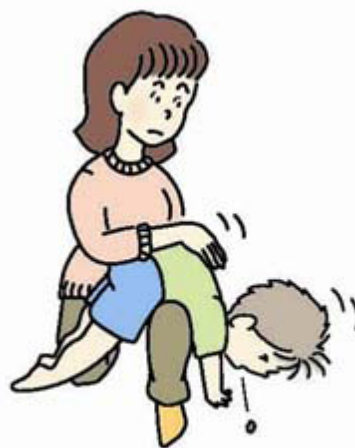
図2 背部叩打法変法 (少し大きい子)