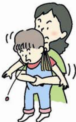
図3 ハイムリッチ法 (年長児)

大人や年長児では、後ろから両腕を回し、みぞおちの下で片方の手を握りこぶしにして、腹部を上方へ圧迫します(図3)。この方法が行えない場合、横向きに寝かせて、または、座って前かがみにして背部叩打法を試みます。