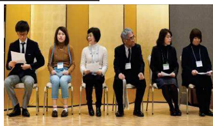
分散交流会・グループ発表代表者