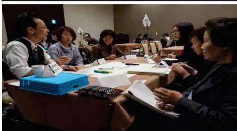
分散交流会(グループ討議)の様子