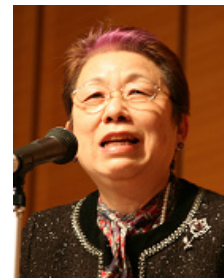
消費者庁 阿南長官