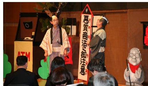
劇団どてかぼちゃが 悪質商法を退治