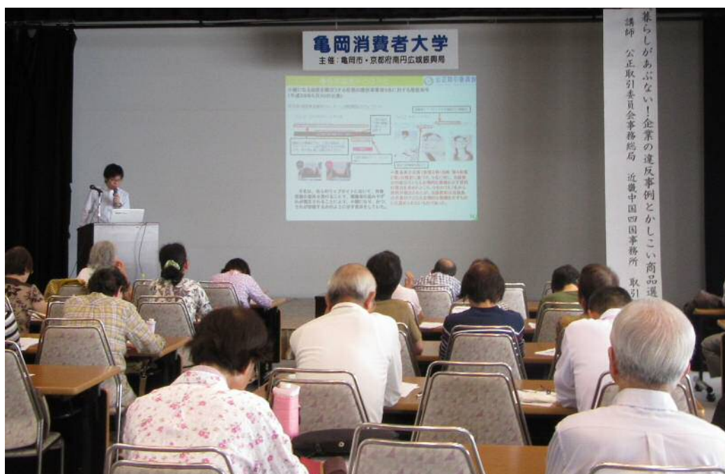
亀岡消費者大学（京都府亀岡市）（平成29年9月29日）

一般消費者等を対象としたセミナーにおいては、景品表示法に係る違反事例を数多く紹介することにより、不当表示に気を付けるよう注意喚起を行った。