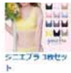
ジエブラ 3枚セッ ト