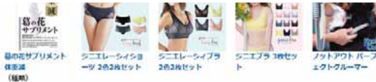
葛の花サプリメント 体保湿 (極潤)