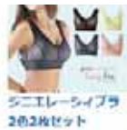
ジエレーライブラ 2色2枚セット