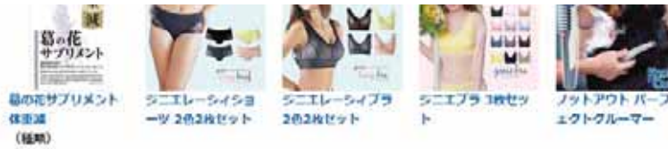
葛の花サプリメント 体脂肪 (種類)