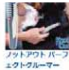
ノットアウト パー フェクトブラマー