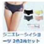
ジエレーライショ ーツ 2色2枚セット