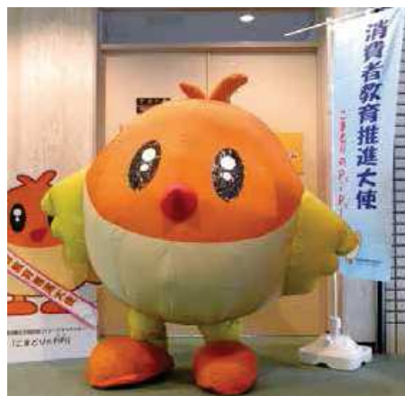
こまどりのPiPi(愛媛県)