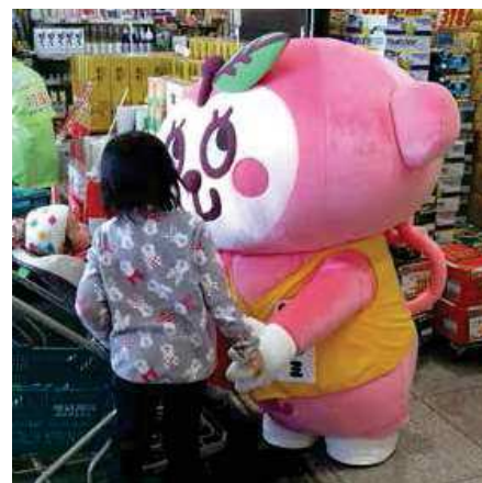
テルミちゃん(青森県)