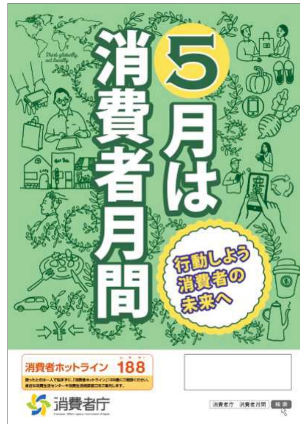
平成29年度消費者月間ポスター