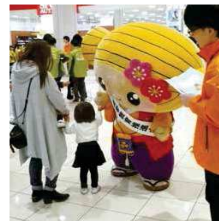
みとちゃん(水戸市)