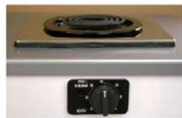
一口こまろ(前面操作) ※写真は富士工業製

身体や物が接触し、意図せずスイッチが「入」となる可能性がある構造であったために、電気こまろの上や周囲に可燃物が置かれていて、火災事故に至る危険性があります。