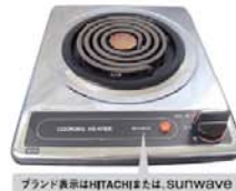
ブランド表示はHITACHIまたは、SUNWAVE