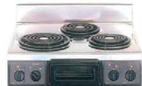
複数口こまろ(前面操作のみ)