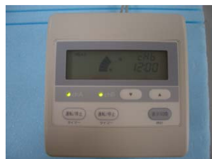
2回路用コントローラ