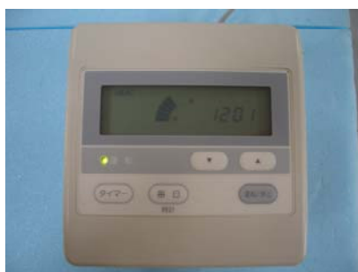
1回路用コントローラ