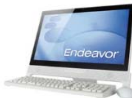
タッチ対応液晶仕様