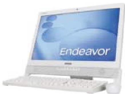
スタンダード液晶仕様