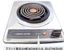
ブランド表示はHITACHIまたは、SUNWAVE 一口こんろ(上面操作)