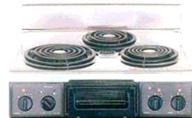
複数口こんろ(前面操作のみ)