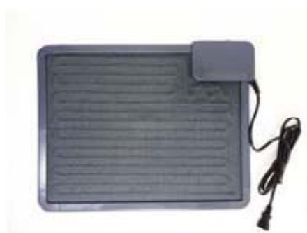
暖ったかSUNヒーター (NN8920B)