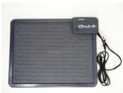
ピタットヒーター (NN8920)