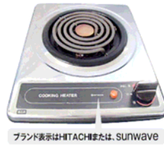
ブランド表示はHITACHIまたは、SUNWAVE 一口こんろ (上面操作)