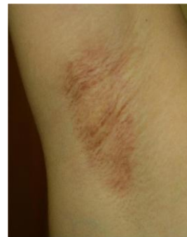
図2 脱毛後に色素沈着が残った例(女性:わき)