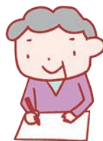
図2 健康食品手帳の例